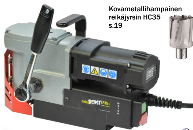
Kovametallihampainen reikäjyrsin HC35 s.19

Huom. Soveltuu käytettäväksi leikkuupituudeltaan 35mm olevien kovametallihampaisten terien kanssa. Näillä saavutetaan noin 30mm leikkuusyvyys.